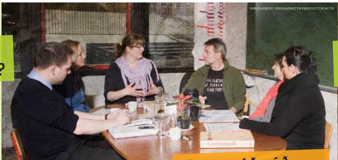
Faldarin er grundaður á „Foreldremøter kan redusere ungdomsfylla“, ein faldari, sum heilsumyndugleikarnir í Noregi hava gjørt – tó er hann tillagaður føroysk viðurskiifti.

Í Noregi hefur gongdin verið øðrvísi. Eftir nógv ár við stórum vøkstri er rúsdrekkanýtslan hjá ungum undir 18 ár minkað tey seinastu árin. Hetta kemst millum annað av, at foreldur eru meira tilvitað í síni støðu.